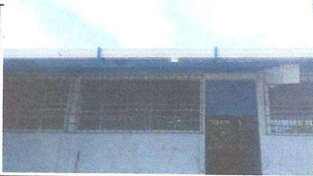
Foto 5: Sustrucción de canal, Sustrucción de soporte o pescante de metal para canal